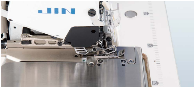
3 Sensörlü, Manyetik, Otomatik İplik Kesme Sistemi

Direct Drive, 3 Sensörlü, Manyetik İplik Kesmeli (Giyotin Tip) ve Ayak Kaldırmalı, 6 İplik (7 mm) / (9 mm) Akıllı Overlok Makinesi