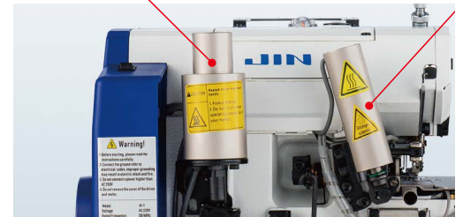
Hava Gerektirmeyen Elektrikli Sistemler